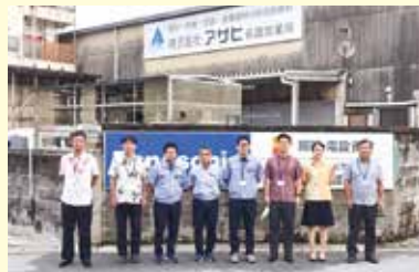
名護営業所のみなさん