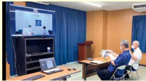
八重山営業所：リモートで審査