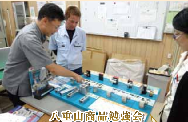
八重山商品勉強会 電路資材や防火措置材を学ぶ

5月24日(土)糸満市にある西崎野球場にてアサヒ野球大会が行われた。20代VS30～40代での試合を行い、30～40代が勝利しました。その後打ち上げも行い皆で交流を深めました。