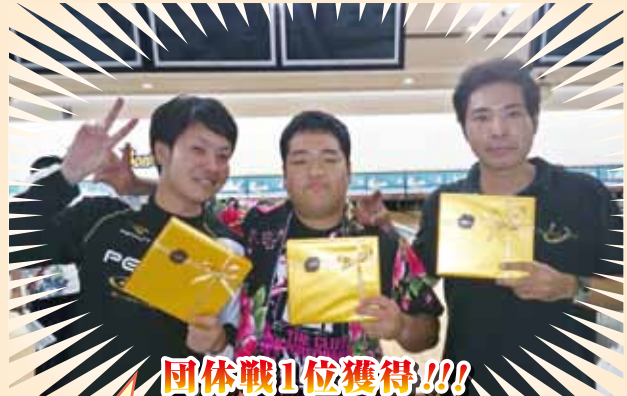
団体戦1位獲得!!! 挑戦者求む!

6月10日(火)当社八重山営業所にてネグロス電気さんの商品勉強会を行った。商品を見ながらの勉強会はとても分かりやすく、すぐに業務に活かす事が出来るのでいい機会となりました。