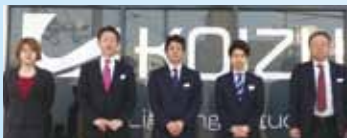
営業所員の皆さま

照射したいものを設置することで現実に近い光のシーンをつくり出し、効果検証していただけます。 また、お客様のご要望に応じ空間を設定し、実際の光を見ながら、意見交換ができればと思います。 このラボではLED照明を通じてお客様と自由な交流やアイデアの交換など、ヒト・モノ・コトが有機的に交わる場にしていきたいとも考えております。また、照明セミナーや新製品説明会などの開催も計画しております。今後とも所員ともどもお客様とは、WIN-WINの関係が築けるように精進してまいりますので、引き続きのご指導ご鞭撻をよろしくお願いいたします。