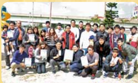
松工会友の会ボウリング大会に参加したアサヒの社員