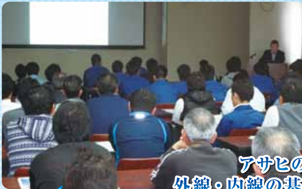
アサヒの若手社員 外線・内線の基礎知識向上を図る

2月14日(土) 浦添のジスタスにて健康増進を行いました。専門のインストラクター指導のもと、気功を取り入れたストレッチという事で全社員で動き普段の運動不足を実感いたしました。