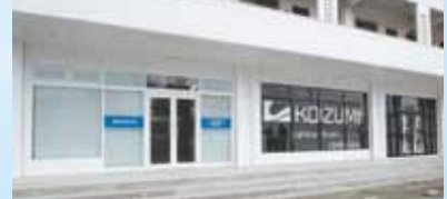
コイズミ照明事務所の外観

照射したいものを設置することで現実に近い光のシーンをつくり出し、効果検証していただけます。 また、お客様のご要望に応じ空間を設定し、実際の光を見ながら、意見交換ができればと思います。 このラボではLED照明を通じてお客様と自由な交流やアイデアの交換など、ヒト・モノ・コトが有機的に交わる場にしていきたいとも考えております。また、照明セミナーや新製品説明会などの開催も計画しております。今後とも所員ともどもお客様とは、WIN-WINの関係が築けるように精進してまいりますので、引き続きのご指導ご鞭撻をよろしくお願いいたします。