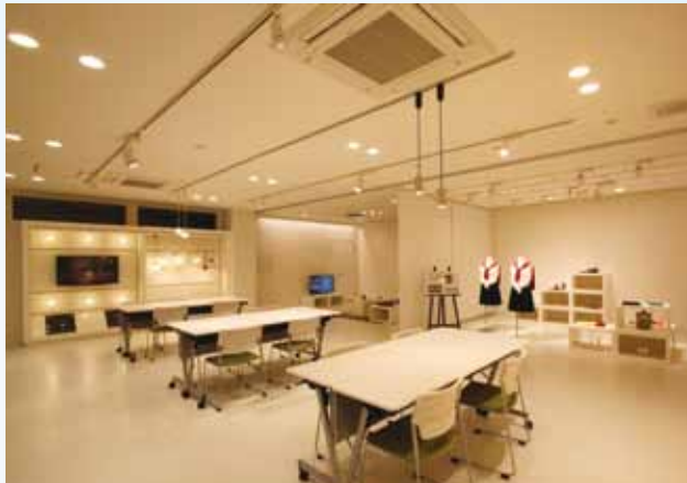
オフィス・ラボ沖縄

平素より弊社製品に格別なるご愛顧とご支援を賜り、有り難く厚く御礼申し上げます。 弊社は住宅照明、店舗施設照明を事業領域とし、器具の開発と照明計画を通して、省エネと快適空間づくりを実現します。人の活動があるところに、常に照明があります。照明技術の進歩が、その都度新しい生活領域・様式を生み出してきたことは、歴史が証明するところです。私どもは、60年を越える歩みを