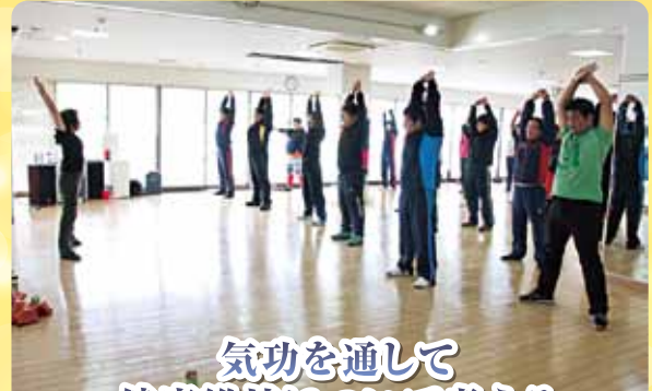
気功を通して 健康維持について考える

1月24日(土) 全社員研修にて防災訓練を行いました。避難経路の再確認や、消火器・消火栓の使用方法について沖縄エンジニアリングさんに教えていただきました。