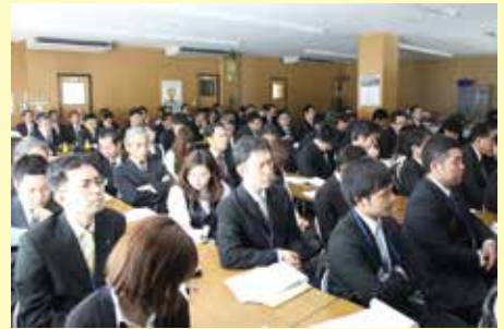
方針発表会を開き入る全社員