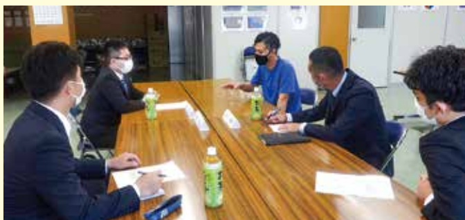
先輩社員とのミーティング