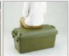
フタが頑丈な造りのため、 人が腰かけても安心です。