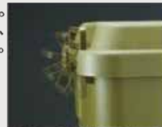
大型バックルは持ち手として 掴むことができます。