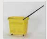
牽引も可能です。 トラスコ中山商[706280]