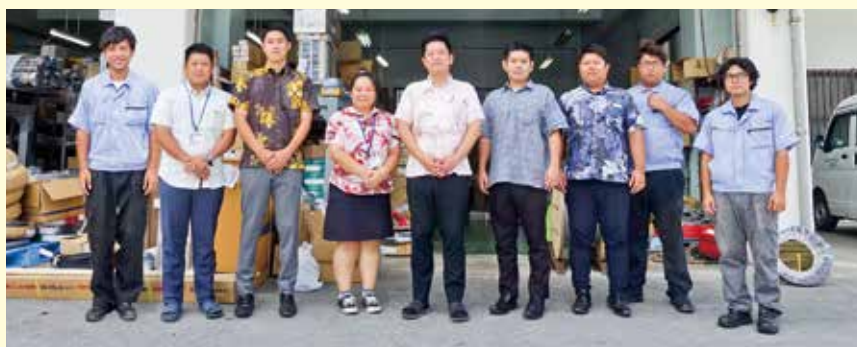
社員紹介(写真右より)