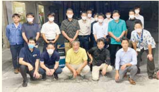
出展メーカーの皆様