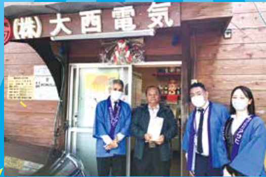
株式会社大西電気 様