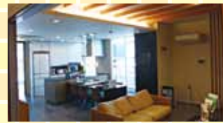
リニューアルオープンしたショウルーム

ば幸いです。 野において はLED照 明を中心と した様々な 省エネ商材 やBEMSに 対応した省 エネシステム機器を総合的にご 提案させて頂き、新たな事業領 域を皆様と共に開拓していき たいと考えております。