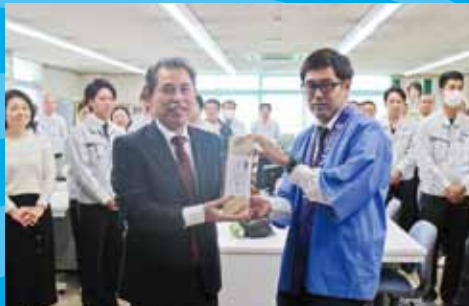
三協電気工事株式会社様