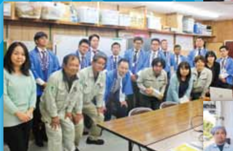
南西電設株式会社様