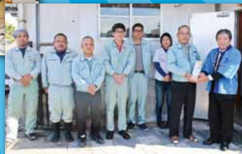
有限会社 シンクウ電建様