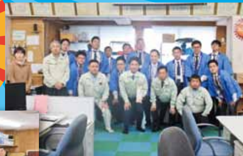
照屋電気工事株式会社様