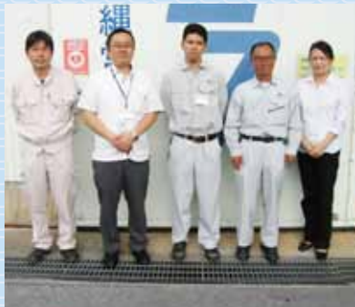
営業所員の皆さま