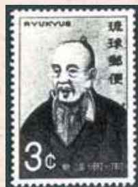
琉球切手に使用された蔡温

三司官就任の4年後に立案した政策「御教条」には「琉球の人民はどうあるべきか、どうするべきかを示している。土族のありかた、地頭職の役割、農民の義務、子供の教育、敬老の精神、ユタの禁止」など