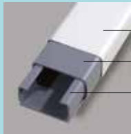
金属+樹脂の ハイブリッド構造