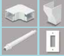
豊富な付属品で 様々な環境に対応