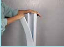
着脱が簡単な はめ込み式構造で 取付けがラク