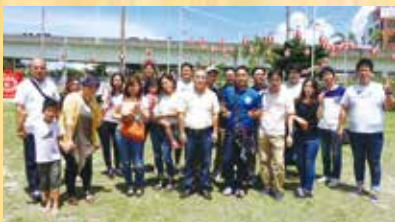
ボウリング大会に参加したアサヒ社員