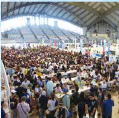
会場は身動きもとれないほど満員に

初日のオープニングセレモニーは200名以上が出席して開幕しました。メーカー様出展の今回の製品は、新で安全性・デザイン性・機能性に優れた製品が数多く出展されていました。家族連れで楽しめるイベントも数多く準備しており、特に戦隊ショーは人気で会場は大盛況でした。ご来場頂いた方々に心より感謝申し上げます。