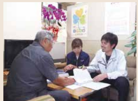
(有)Cai設備様のミーティングの様子

ネット社会に育った若い世代は、ネットやコンピューターの扱いは一歩進んでいて、CADや、計算ソフトへの慣れも、年配者に比べ可能性は高く、此れからの設備設計業界への、女子力の活躍を期待できると信じています。