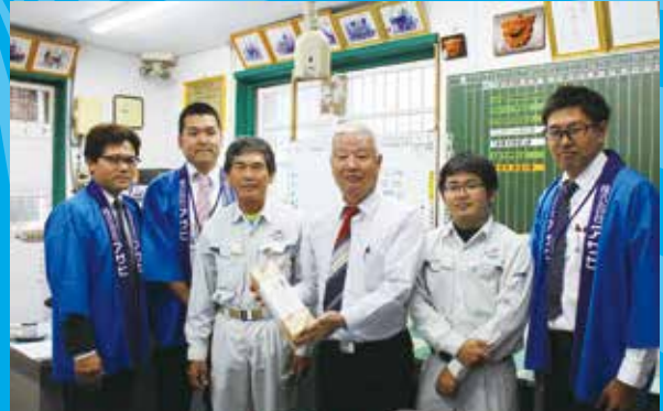
株式会社ケイアイエム 様