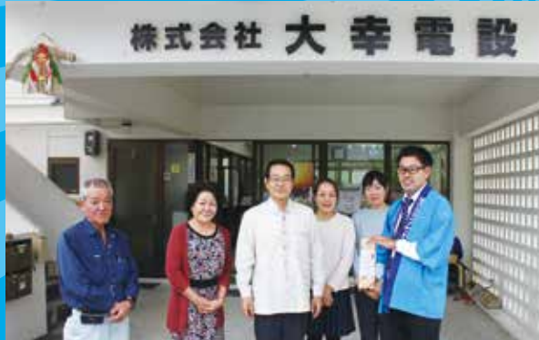
株式会社大幸電設 様