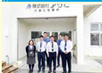
八重山営業所のみなさん