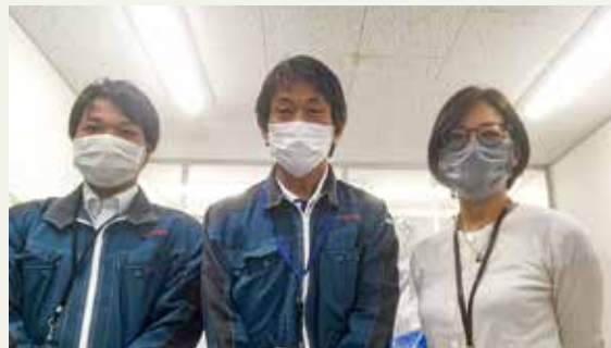
沖縄営業所の皆様

弊社の至らない点につきましては遠慮なく御指摘下さい。アサヒ様の生のお声に耳を傾ける事が何より重要であると認識しております。